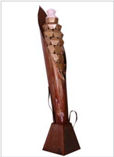
NOME DO AUTOR: Jaime Carvalho CIDADE/PAÍS: S. Domingos de Rana | Portugal NOME DA OBRA: Espiga TÉCNICA: Chapa de metal e mármore DIMENSÃO: 170*30*50 cm ANO: 2011