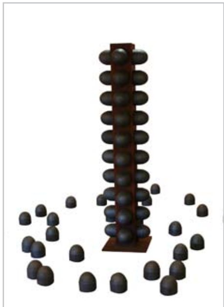
NOME DO AUTOR: Marta Vallejo CIDADE/PAÍS: Castellón | Espanha NOME DA OBRA: La unidad TÉCNICA: Aço e pedra artificial DIMENSÃO: 250*250*200 cm ANO: 2011