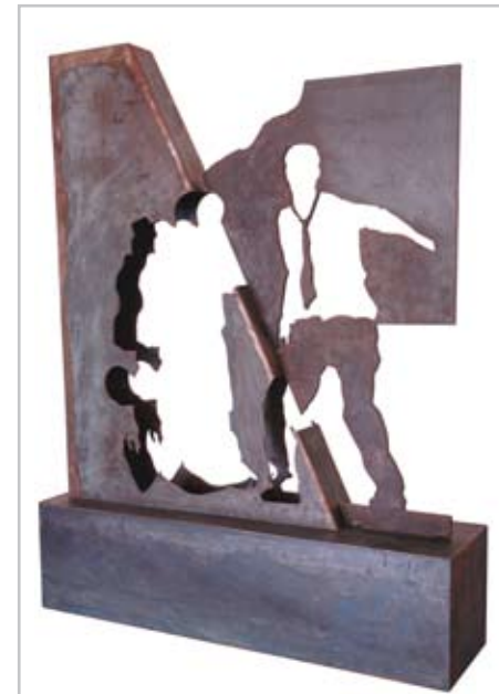
NOME DO AUTOR: Enrique Ramos Guerra CIDADE/PAÍS: Sevilha | Espanha NOME DA OBRA: Transparencias de un hombre al que solo quedo la corbata TÉCNICA: Aço DIMENSÃO: 117*86*23 cm ANO: 2000