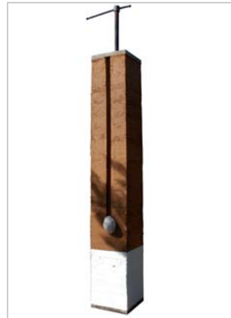
NOME DO AUTOR: Aldo Passarinho CIDADE/PAÍS: Setúbal | Portugal NOME DA OBRA: Parafita de reia TÉCNICA: Ferro cortene; taipa; pedra; cimento DIMENSÃO: 260*50*50 cm ANO: 2011