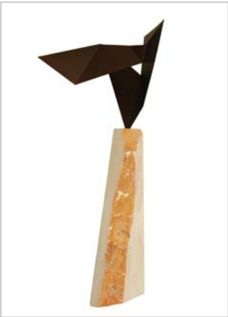
NOME DO AUTOR: Hugo Maciel CIDADE/PAÍS: Quinta do Conde | Portugal NOME DA OBRA: Tensão e Alma do Ferro TÉCNICA: Aço e mármore DIMENSÃO: 200*100*60 cm ANO: 2010