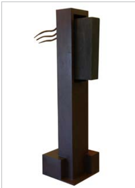
NOME DO AUTOR: Victor Delgado CIDADE/PAÍS: Castellón | Espanha NOME DA OBRA: La mirada del maestro TÉCNICA: Aço e pedra artificial DIMENSÃO: 500*1200*2000 cm ANO: 2008