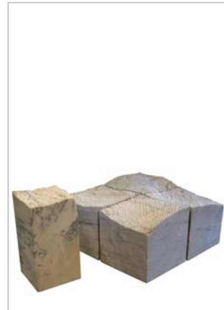
NOME DO AUTOR: Filomena Almeida CIDADE/PAÍS: Vila de Cucujães | Portugal NOME DA OBRA: Bancos Contemplação TÉCNICA: Pedra mármore DIMENSÃO: 120*80*55 cm ANO: 2007