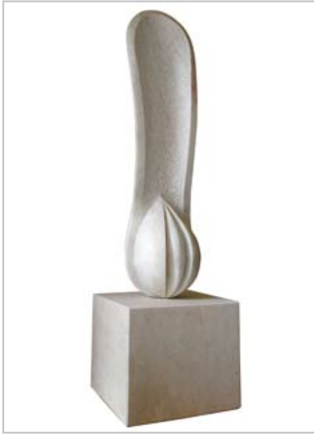
NOME DO AUTOR: Leandro Sidoncha CIDADE/PAÍS: Vila Verde de Ficalho | Portugal NOME DA OBRA: Semente TÉCNICA: Mármore DIMENSÃO: 160*40*40 cm ANO: 2011