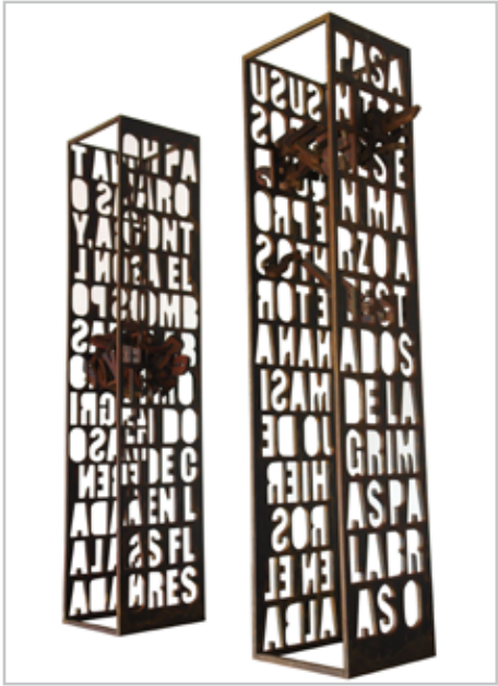
NOME DO AUTOR: Jesus Algovi CIDADE/PAÍS: Sevilha | Espanha NOME DA OBRA: Torre I e II TÉCNICA: Aço DIMENSÃO: 200*45*60 cm (cada torre) ANO: 2007