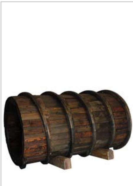
NOME DO AUTOR: Rui Horta Pereira CIDADE/PAÍS: Lisboa | Portugal NOME DA OBRA: Deixar andar TÉCNICA: Madeira tratada DIMENSÃO: 200*110 cm ANO: 2010