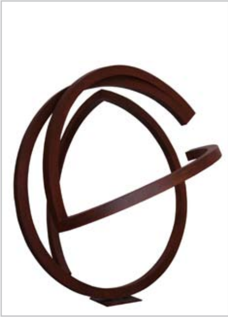
NOME DO AUTOR: Juan Carlos Marín CIDADE/PAÍS: Sevilha | Espanha NOME DA OBRA: Mitote TÉCNICA: Aço DIMENSÃO: 135*145*124 cm ANO: 2011