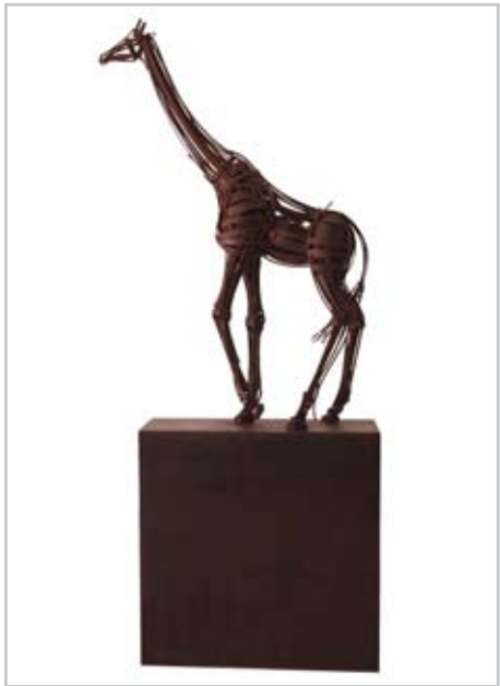
NOME DO AUTOR: Fernando Suárez Reguera CIDADE/PAÍS: Madrid | Espanha NOME DA OBRA: Girafa II TÉCNICA: Ferro DIMENSÃO: 204*90*30 cm ANO: 2009